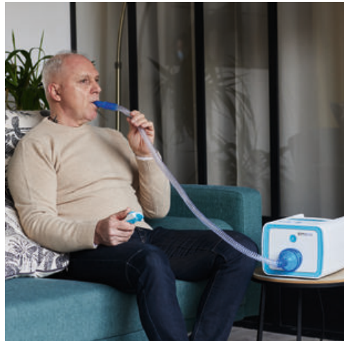
Abb. 1: © PhysioAssist

Sehr erfolgreich wird Simeox bei Bronchiektasen, COPD/Chronischer Bronchitis, schwerem Asthma und anderen Lungenerkrankungen mit Hypersekretion eingesetzt. Inzwischen sind in Deutschland schon viele hundert Patienten mit Simeox versorgt und nutzen das Gerät als Bestandteil der selbständigen Therapie zu Hause mit Kostenerstattung durch GKV und PKV.